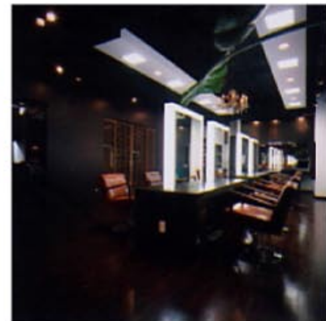
スタイルングスペース、セット荘の台の幅を大きくとって、使い勝手を向上させた