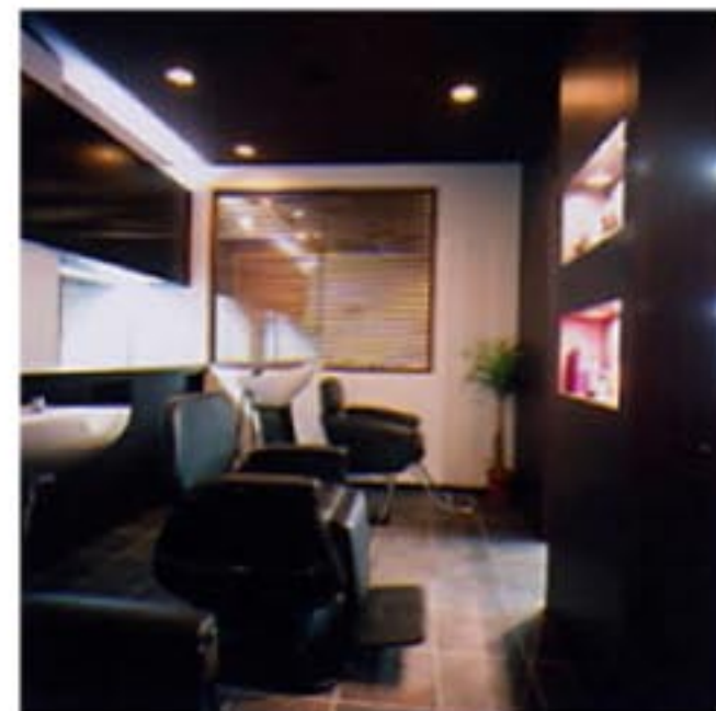
リアシャンプー1台とサイドシャンプー2台が並ぶシャンプースペース。奥の格子からはヘッドスパ専用ルームが見える