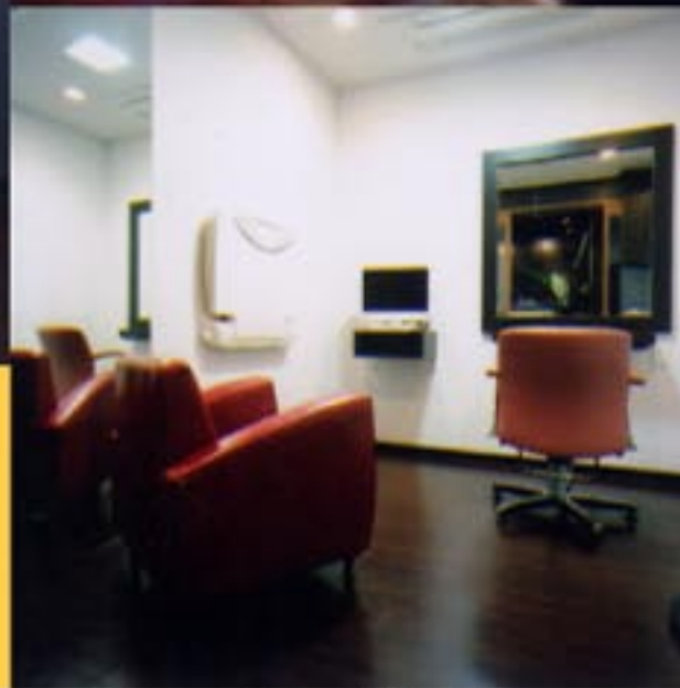
(左上) スタイルングスペースに面するヘッドスパ専用ルームは、開け閉めを引くことにより、早仕上がりになる。ヘッドスパは専任のスタッフが施術する (右上) 犬専用のトリミングサロンは店外から見て、一番目立つ場所にある (右下) ベッドシートやDVD観覧用のモニターを完備したプライベートファミリールーム。ほぼ個室になっているため、受付専用の個室としても転用できる